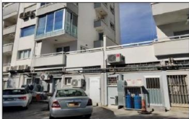
Σχ.: 2-207-340, Αρ. Τεμαχίου: 128, Αρ. Εγγραφής: 0/22241